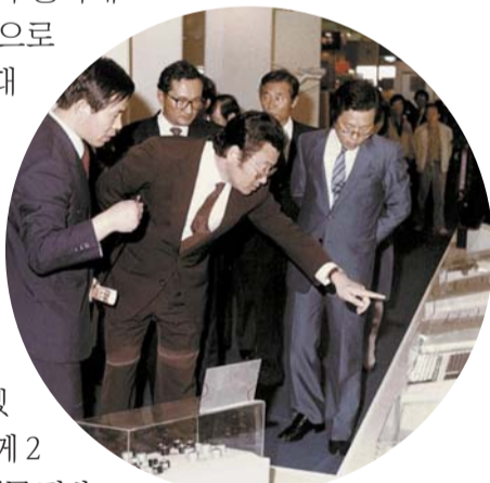
대통령은 시간을 내어 경제현장을 찾았다. 사진은 1983년 11월 경인에너지 인천공장(현 SK인천석유화학)에 방문한 모습.

있을 때 대통령이 청와대 본관 소(小)식당으로 나를 불렀다. 전 대통령은 “이봐, 사공수석. 전임자가 없으니, 경제수석 업무를 인계해 줄 사람이 없지 않나. 내가 직접 해야겠다”며 오찬과 함께 2시간 넘게 수석 업무 전반에 관한 소상한 설명과 함께 구체적 지침을 줬다.