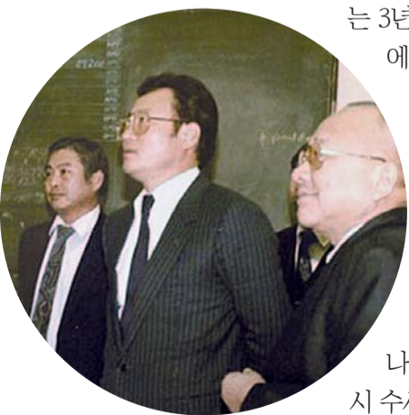
경제수석이던 1984년 중소기업 전시회를 참관하는 모습.