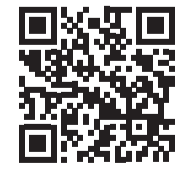
스마트폰 카메라 앱으로 QR코드를 스캔하면 The JoongAng Plus에서 연재 중인 사공일 회고록: 경제국정, 이랬다 시리즈를 더 자세히 보실 수 있습니다.

강력한 대통령 책임제하에서는 대통령실의 역할이 중요할 수밖에 없다. 특히 모든 분야 전문가가 아닌 대통령이 국정 모든 분야 정책 판단을 비서진의 자문역할로 맡겨줘야 하기 때문이다.