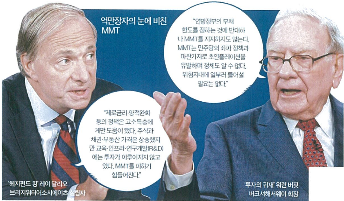
억만장자의 눈에 비친 MMT