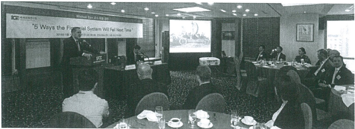
13일 서울 중구 한국프레스센터에서 열린 세계경제연구원 주최 특별강연에서 마이크 바 교수가 강연을 하고 있다.

따라서 ‘유연한 규제’로 혁신의 리스크를 관리하면서 다른 한편으로 혁신의 혜택까지 얻을 수 있도록 해야 한다고 특별히 강조했다.