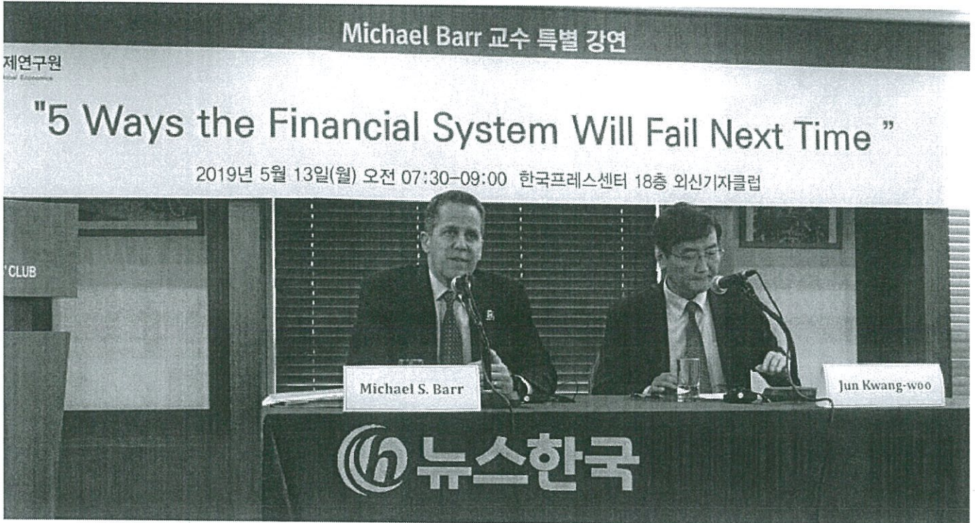
마이클 바 미국 미시건대 제너럴 포드 공공정책대학원장이 13일 오전 서울 한국언론진흥재단에서 열린 세계경제연구원 주최 조찬 강연회에서 강연을 한 후 참석자들에게 질문을 듣고 답했다. (뉴스한국)

미국 미시건대 제너럴 포드 공공정책대학원장 세계경제연구원 초청 조찬 강연