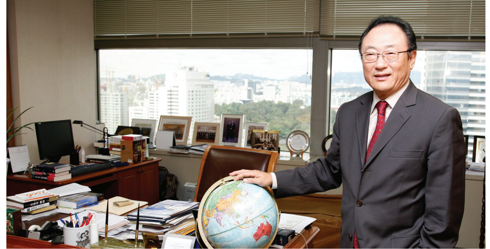
Since its launch the Institute for Global Economics has invited world-famous speakers, and hosted forums with local and overseas economic experts and opinions leaders, thereby spreading latest information on the global economy.

“한국 경제의 글로벌체제 편입은 기업 스스로가 살아남기 위해 노력해온 결과입니다. 디지털경제 시대에 거리라는 장애요소가 없어짐으로써 지구 전체가 글로벌화의 일원으로 편입되어 경제활동 외연을 확장할 수 있습니다.”