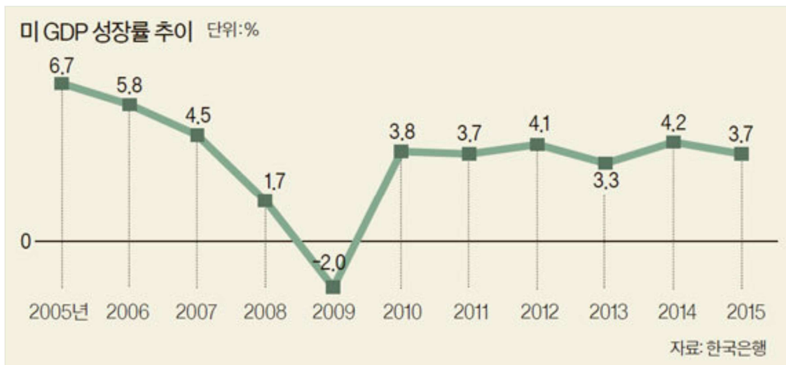
미 GDP 성장률 추이